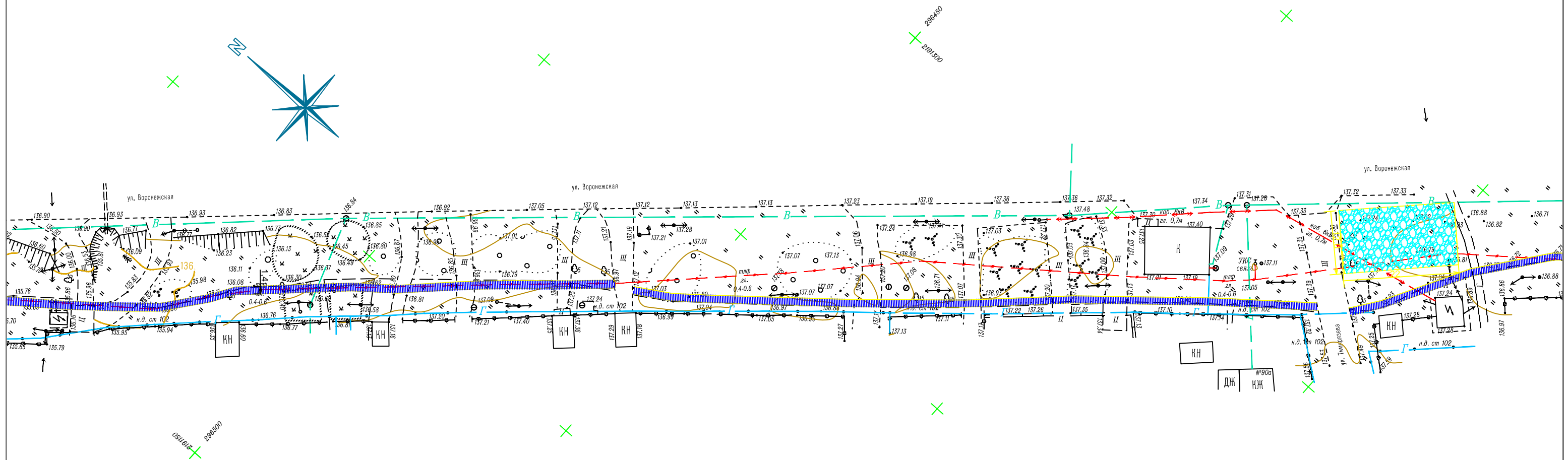
Ведомость малых архитектурных форм